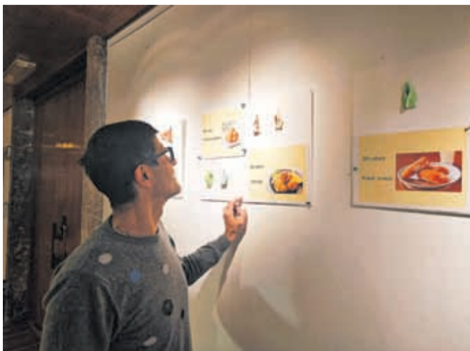
V občinski galeriji poteka razstava izdelkov otrok iz japonskega mesta Fukui.