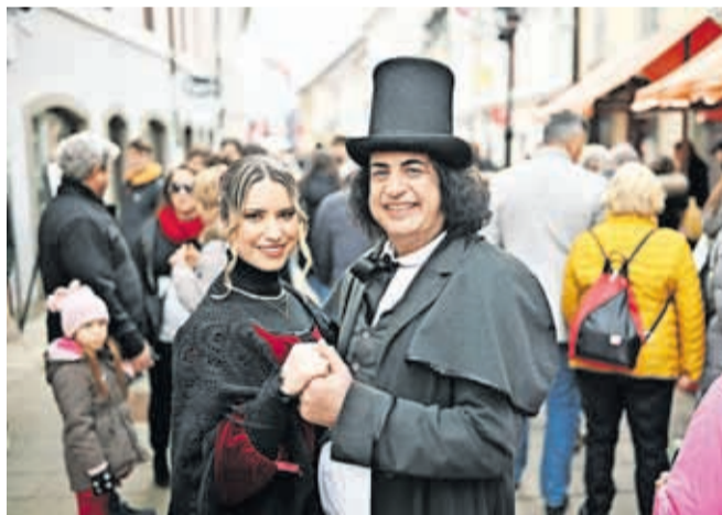
Stalna spremljevalca Prešernovega smenja sta tudi lika Franceta Prešerna in njegove spremljevalke Primičeve Julije, s katerima so se želeli fotografirati številni obiskovalci.