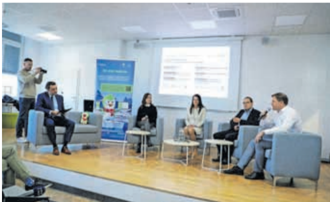
V Kovačnici so predstavili okoljski projekt Zeleni pingvin.

nizacije in celo cela mesta uči, kako zmanjšati izpuste z uporabo manj virov. Zeleni pingvin torej izkorišča pametne digitalne tehnologije, ki otrokom omogočajo spremljanje in beleženje njihovih dejavnosti, zbrane podatke pa združijo oziroma povežejo s podatki o porabi energije in virih šolskih ter drugih stavb. Projekt je delno financiran s sredstvi Norveškega finančnega mehanizma in s sredstvi Ministrstva za kohezijo in regionalni razvoj. Vodilni partner je podjetje Iskraemeco, poleg Mestne občine Kranj pa so vključene še Mestna občina Ljubljana (MOL), DOVES FEE Slovenija – Ekošola ter Foundation for Environmental Education Norway (Fundacija za okoljsko izobraževanje Norveške).