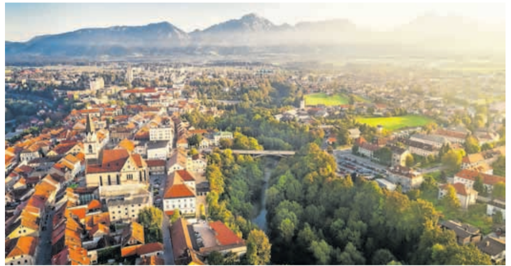
Za osrednjo temo EKO tedna v Kranju so organizatorji postavili zeleno infrastrukturo mesta in okolice.