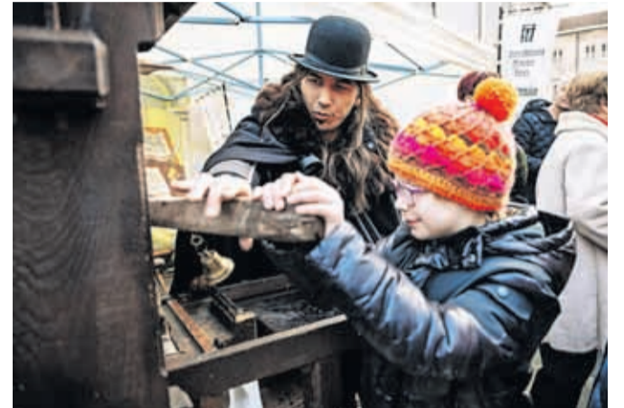
V tiskarni manufakture Mojstra Janeza so se obiskovalci lahko tudi sami preizkusili v ročnem tisku s svinčnimi črkami.