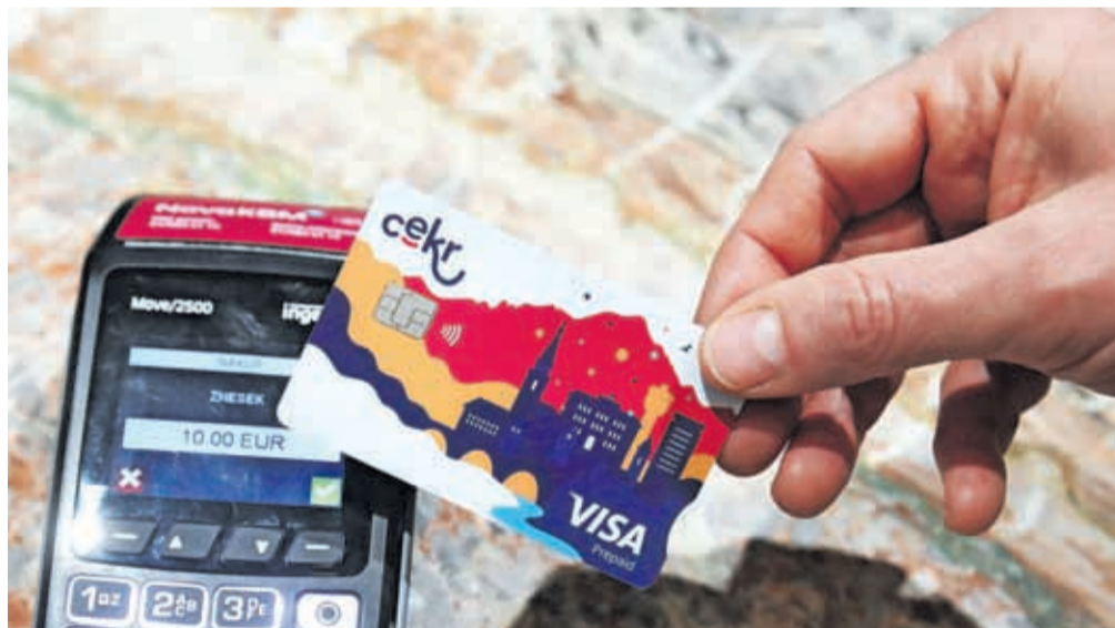
Kranjska mestna kartica CeKR uporabniku omogoča tako identifikacijo kot tudi plačevanje storitev in blaga kjer koli na svetu.

Takšne kartice, kot je kranjska mestna kartica CeKR, v Sloveniji še ni, in ko bo zaživela z vsemi funkcionalnostmi, bo tudi med bolj naprednimi na ravni razvitih pametnih mest, poudarjajo njeni snovalci. Kartica namreč poleg identifikacije uporabnika omogoča plačevanje storitev in blaga kjer koli po svetu ali po spletu. Gre za predplačniško plačilno kartico, ki je osnovana na