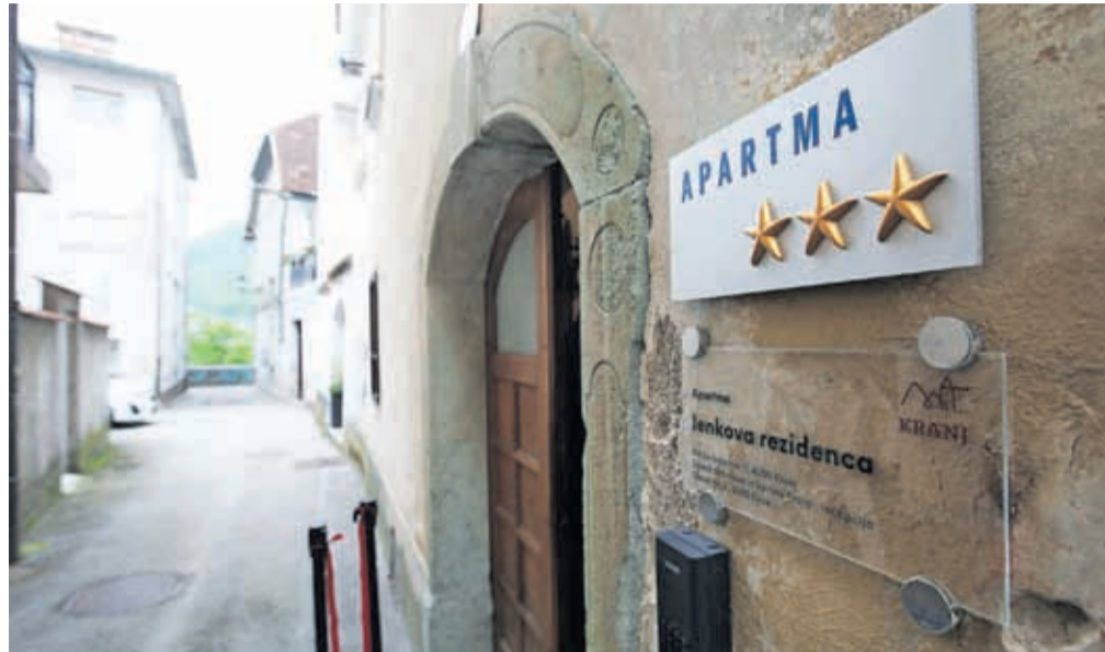
Jenkova rezidenca je poklon pesniku Simonu Jenku, ki je bival v hiši, kjer se rezidenca nahaja.

Društvo Ekologi brez meja, ki so nacionalna Zero Waste organizacija za Slovenijo, med drugim deležnike v turističnem sektorju spodbuja in vključuje v prehod v zeleno gospodarstvo ter trajnostno upravljanje z viri. Da bi Jenkova rezidenca pridobila naziv, smo morali tako zadostiti naslednjim pogojem: ločeno zbranih čez 90 odstotkov odpadkov, uvedba ukrepov za zmanjševanje nastajanja odpadkov, opravljen usposabljanje za zaposlene. A Jenkova rezidenca, kar se tiče trajnostnih ukrepov, presega te zahteve. Jenkova rezidenca je poklon Simonu Jenku, enemu izmed najvplivnejših slovenskih pesnikov, ki je med letoma 1864 in 1866 bival v hiši, kjer se rezidenca nahaja, s čimer želimo navdihovati goste, ki tam bivajo. Po-