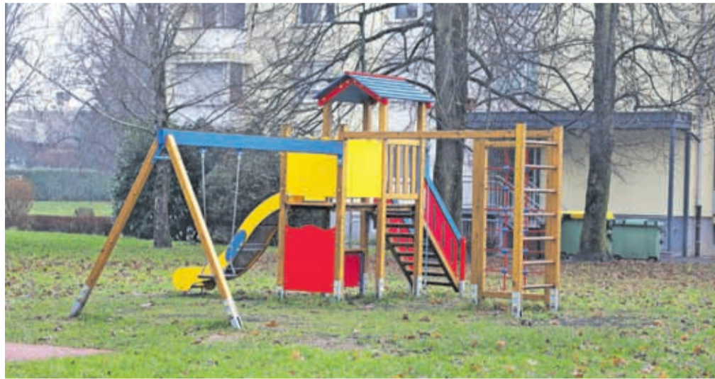
KS Vodovodni stolp – obnovljena igrala na Šorlijevi ulici

Največ izglasovanih projektov je bilo povezanih z izboljšavami športnih infrastruktur in igrišč. Urejeni so novi garderobni prostori v Športnem parku Bitnje, v KS Bratov Smuk so postavljeni športni drogovi za fitnes na igrišču Osnovne šole (OŠ) Matije Čopa, pri OŠ Janeza Puharja v KS Center so pridobili dve novi mizi za namizni tenis, v Športnem parku Čirče je postavljen nov fitnes na prostem. Preplastitev oz. obnovitev košarkarskih igrišč je bila izvedena v KS Huje pred OŠ Jakoba Aljaža, v KS Kokrica pri družnični šoli OŠ Franceta Prešerna, pri OŠ Predoslje ter pri OŠ Stražišče. Pri družnični šoli Primskovo OŠ Janeza Puharja so bogatejši za tekaško stezo s poligonom za skok v daljino. Nadaljevali so z ureditvijo športnega parka Struževu, ki so ga v okviru participativnega proračuna začeli urejati v letu 2022. V KS Vodovodni stolp je obnovljeno otroško igrišče v Šorlijevem naselju. V KS Zlato polje je ob pasjem parku postavljen nov rekreativni park. V KS Hrastje je bila izdelana projektna dokumentacija za postavitev