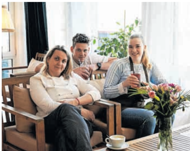
Umami Boutique Kranj je kavarna in slaščičarna na Hujah.