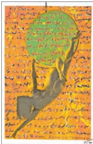
Zoran Ogrinc in Boštjan Gunčar

Kranj – V galeriji Kranjske hiše bo od 4. marca do 7. aprila svoja dela iz projekta Sodelovanja razstavljal kranjski fotograf Boštjan Gunčar. Eden najbolj prepoznavnih kranjskih fotografov se je konec osemdesetih let preteklega stoletja uveljavil s fotografijami ženskega akta v črno-beli tehniki. Temu fotografskemu motivu se kontinuirano posveča. S projektom Sodelovanja se je odločil za dialog med fotografijo in slikarskimi izrazi ter svoj fotografski svet ponudi slikarjem in drugim likovnim ustvarjalcem kot izhodišče za udejanjenje njihovih likovnih razmišljanj. Od tod tudi naslov fotografsko-likovnega projekta Sodelovanja. Spremembo besede k razstavi je pripravil ddr. Damir Globočnik, ki o Gunčarjevi fotografiji pravi, da gre za zvrst t. i. lepega akta. Fotografija, kot pravi ddr. Globočnik, je dokument, v drobci ujeta podoba, ki je nastala brez odtisa človekove roke. Vendar je fotografija akta, tj. golega človeškega telesa, tisti motiv, ki fotografijo morda najbolj povezuje s slikarstvom in kiparstvom. O sodelovanju pa