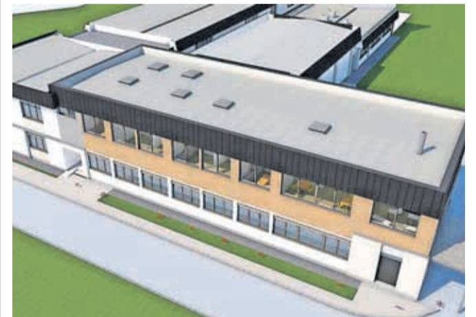
Grafični prikaz Osnovne šole Helene Puhar po dozidavi, nadzidavi in rekonstrukciji

Na OŠ Helene Puhar se je število vpisanih otrok, ki potrebujejo prilagojen učni program, v zadnjih letih zvišalo za več kot 30 odstotkov. V letošnjem šolskem letu je vpisanih 161 učencev. Vseh oddelkov je trenutno 25, kar je 8 več kot v šolskem letu 2020/2021. »Zaradi vedno večjega vpisa smo imeli zad-