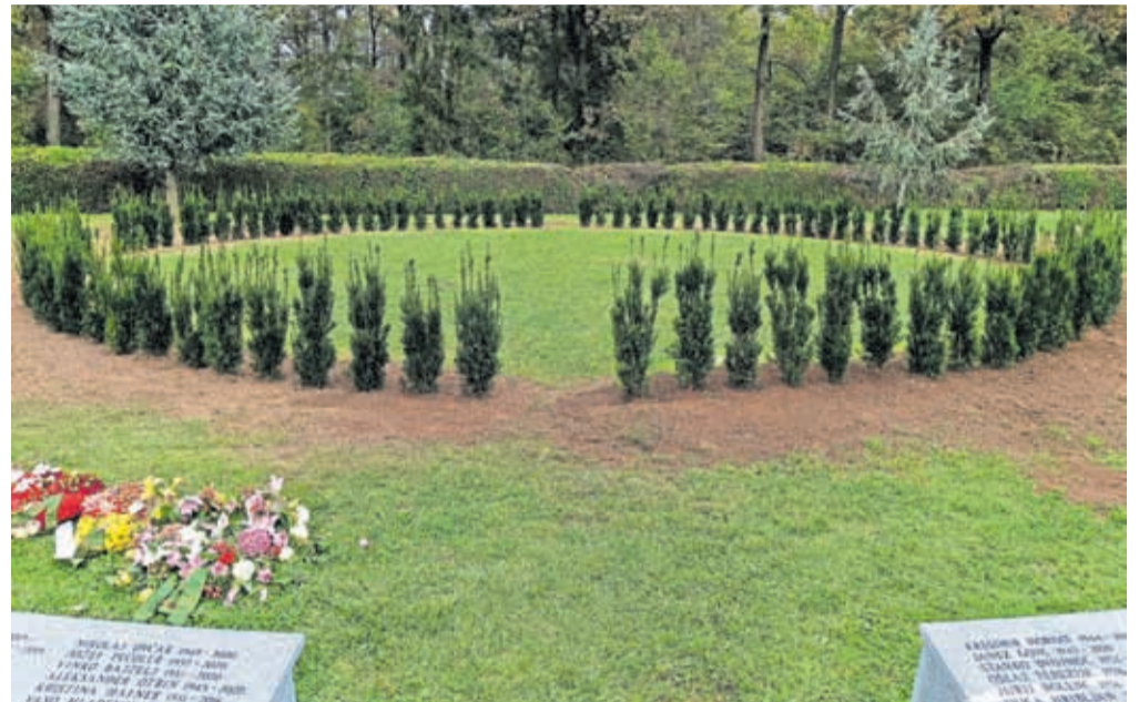
Jeseni je bil preurejen prostor za raztros pepela na Mestnem pokopališču Kranj.

Komunala Kranj po pooblastilu Mestne občine Kranj izvaja tudi upravljanje Mestnega pokopališča Kranj ter Pokopališča Bitnje. Upravljanje obsega tekoče letno in zimsko vzdrževanje, kot sta čiščenje glavnih poti, odprtih javnih površin in objektov ter vzdrževanje zelenja in zelenic. Tekoče vzdrževanje se financira z najemninami grobnih prostorov. Pri tem je pomembno poudariti, da je vzdrževanje grobov, njihove neposredne okolice in pro-