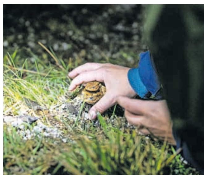
Prostovoljci že več let pomagajo žabam pri varnem prečkanju ceste pod Joštom.

jo prostovoljce, torej vsakogar, ki bi želel pomagati žabam čez cesto. Udeleženci naj imajo s seboj svetilke (najbolje čelne), oblačilo z odsevnimi trakovi, vedro, s katerim bodo prenašali dvoživke, lahko tudi rokavice iz lateksa in nepremočljiva oblačila ter obutev. Za malico in toplo pijačo bo poskrbljeno. Zaradi selitev bo zaprta cesta severno od bobovških jezerc in skozi gozdiček ob jugozahodnem robu Brda, in sicer od četrta, 22. februarja, do nedelje, 25. februarja, od 19. do 23. ure. Morebitne nadaljnje zapore bodo ob deževnih dneh predvidoma do konca marca med 19. in 23. uro.