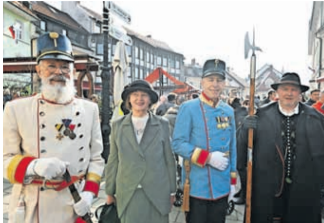
Prešernov smenj je Kranj preoblekel v romantiko 19. stoletja. Po mestu so se sprehajali meščani v opravih izpred skoraj 200 let.

Ulice in trgi starega mestnega jedra Kranja so bili ta mesec dvakrat polni obiskovalcev. Na slovenski kulturni praznik, 8. februarja, je Prešernov smenj v mesto privabil okoli trideset tisoč obiskovalcev, dva dni kasneje, na pustno soboto, 10. februarja, pa so mestno središče napolnile maškare, ki so se udeležile Krančkovega karnevala. Za vas smo izbrali nekaj fotoutrinkov z obeh prireditev.