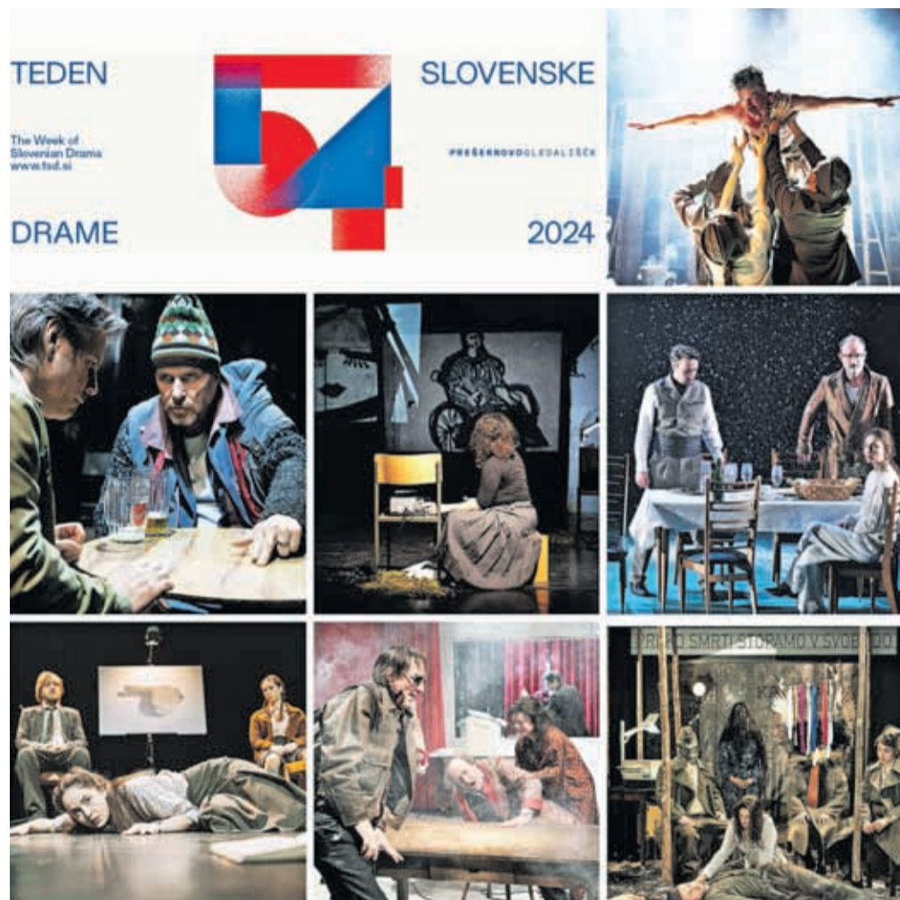
V tekmovalnem programu bomo videli sedem uprizoritev.