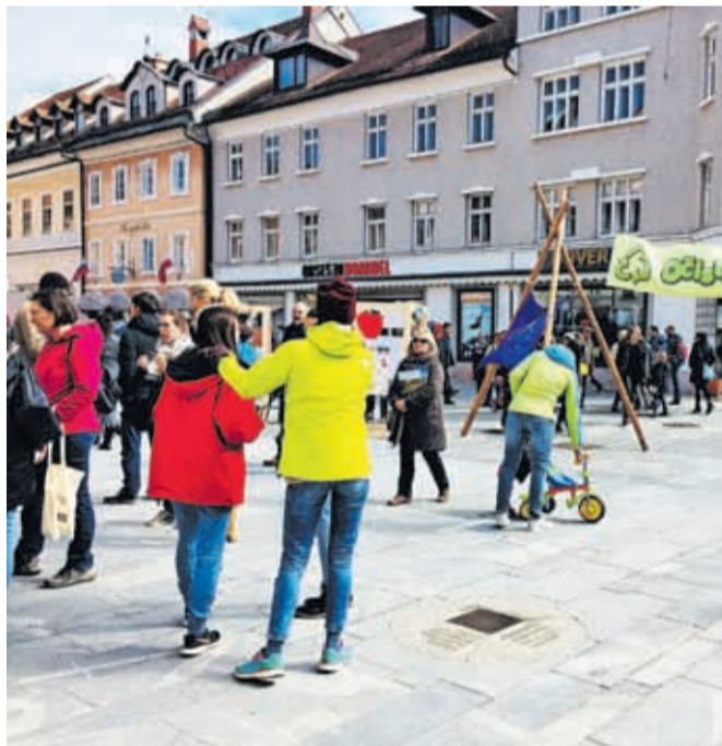
Čistilna akcija bo na območju mestne občine Kranj potekala že 23. leto zapored.

Udeleženci bodo odstranjevali predvsem manjšo nesnago, kot so raznovrstna embalaža pijač in hrane, tekstil in drugi odpadki, pri tem pa bo v pomoč tudi digitalni zemljevid črnih točk. Zato organizatorji občanke in občane prosijo, naj sporočijo, če v svoji okolici naletijo na zasmeteno območje. To lahko naredijo na prep-