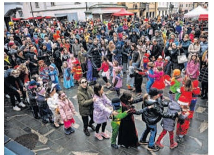
Pustne šeme so na pustno soboto ponovno napolnile mestno jedro Kranja.