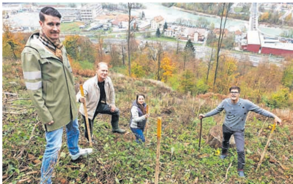
KS Gorenja Sava – zasaditev tisočih sadik dreves