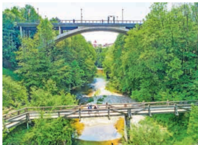
Na predvečer gregorjevega bomo v kanjonu reke Kokre spuščali gregorčke.

V ponedeljek, 11. marca, na predvečer gregorjevega, bomo ob 18. uri v kanjonu reke Kokre spuščali gregorčke. Te si lahko izdelate na delavnici v Kovačnici ob 16. uri. Ker se zavezuemo k trajnostnemu ravnanju, bodo vse barčke, izdelane na naših delavnicah, iz naravnih in razgradljivih materialov, k čemu nagovarjamo tudi tiste, ki bodo barčke izdelali doma. Da ne bi onesnaževali narave in reke Kokre, bomo gre-