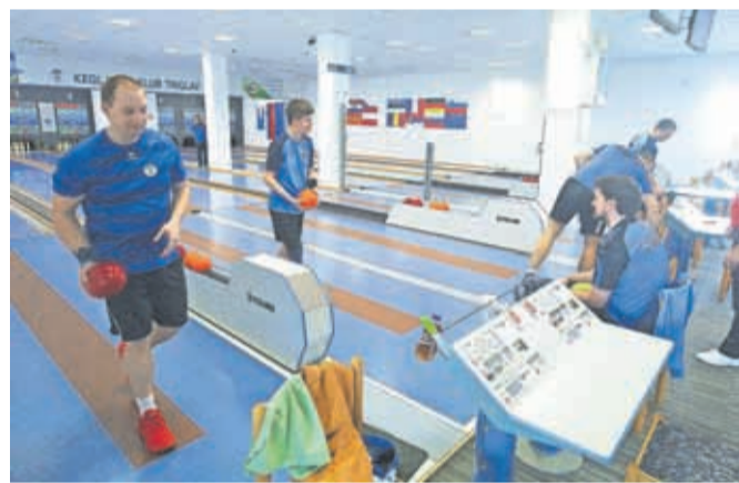
Kegljačem Triglava tudi na sobotni povratni tekmi ni uspelo premagati nemškega Raindorfa.