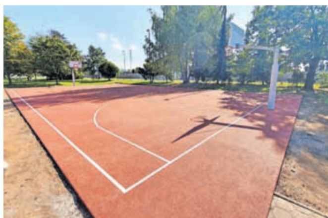
KS Huje – preplastitev košarkarskega igrišča

Izvajanje projektov participativnega proračuna za leto 2024 je v teku, trenutno so projekti v fazi načrtovanja. Mestna občina Kranj (MOK) za naslednjo izvedbo načrtuje dvoletni participativni proračun za leti 2025 in 2026. Za posamezno KS bo v proračunu MOK namenjenih 48.000 EUR sredstev, skupno v dveh letih pa 1.248.000 EUR sredstev za izvedbo participativnega proračuna za leti 2025 in 2026. S tem je MOK občina, ki namenja največ sredstev za izvedbo participativnega proračuna v državi. Po izvedbi treh enoletnih participativnih proračunov se je pokazala omejitev pri izboru projektov, saj so bili lahko sprejeti projekti, ki so bili izvedljivi v enem letu in v najvišji vrednosti 24.000 EUR, večinoma je bil zato izveden le en projekt v KS z največ glasovi. Bistvena sprememba pri prehodu na dvoletni participativni proračun je ta, da bodo sedaj občani lahko predlagali tudi projekte, ki terjajo več kot eno leto od načrtovanja do izvedbe in so finančno zahtevnejši. Ker je višina sredstev na posamezno KS večja, bo lahko izvedenih tudi več projektov v isti KS v skupni vrednosti 48.000 EUR. Od 1. aprila do 30. maja 2024 bodo občani lahko oddali predloge projektov na spletni strani predlagaj.kranj.si, ki se bodo izvedli v letih 2025 in 2026. Glasovanje o predlaganih projektih bo potekalo od 20. septembra do 6. oktobra 2024 po spletu, nato pa bo komisija izglasovane projekte glede na zahtevnost izvedbe razvrstila v izvedbo za leto 2025 oz. leto 2026.