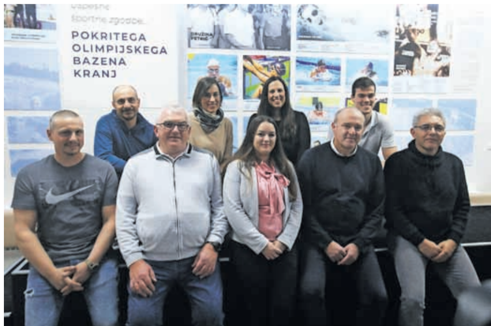
V Galeriji slavnih so predstavljene najboljše športne zgodbe plavalcev in vaterpolskih ekip, ki so se kalili v kranjskem bazenu.