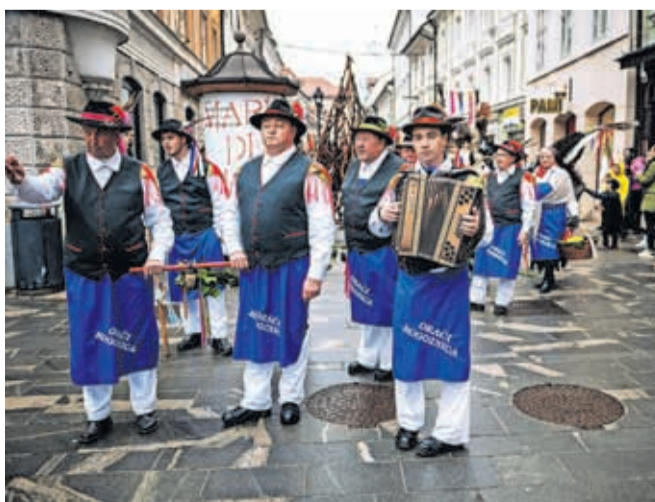
Gostje na Krančkovem karnevalu so bili tudi kurenti in orači iz Rogoznice. Prvi so odganjali zimo, drugi pa napovedovali dobro letino.