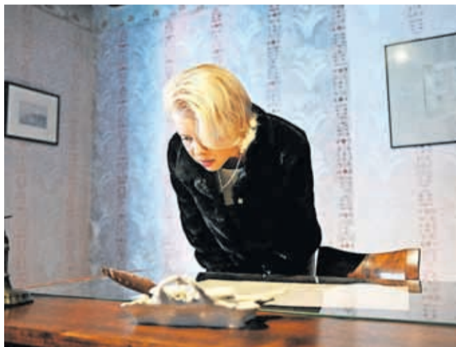
Predsednica državnega zbora Urška Klakočar Zupančič med obiskom Prešernove hiše