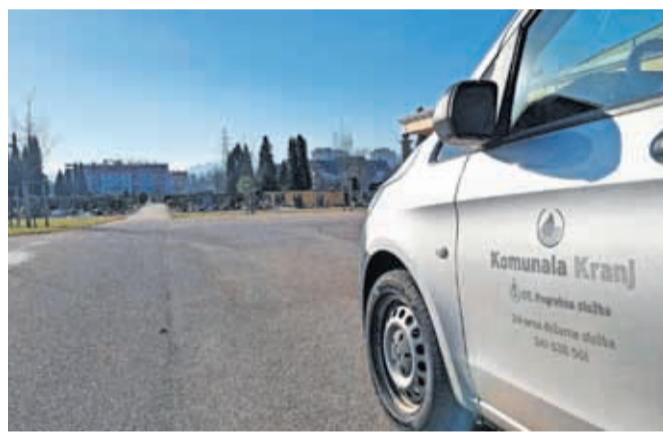
Letošnja pridobitev je novo vozilo za prevoz pokojnikov.